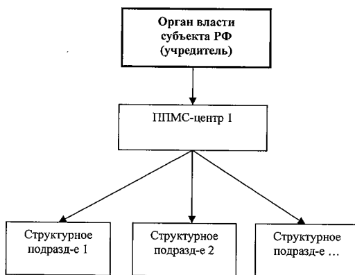
Рис.2. Схема централизованной модели организации деятельности ППМС-центров

В регионе уполномоченным органом власти создается Центр с филиалами, которые распределяются в соответствии со спецификой территориального расположения, численностью детского населения и его потребностью в помощи. Центр представляет собой жесткую иерархическую систему оказания психолого-педагогической, медицинской и социальной помощи. Такая структура позволяет обеспечить высокую централизацию управления, единый стандарт услуг, рациональное использование кадровых и финансовых ресурсов, прозрачность и достоверность результатов деятельности.